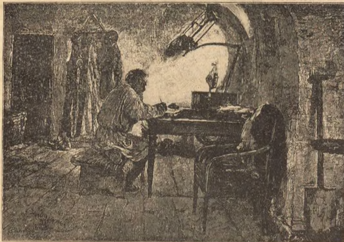
Л. Н. Толстой въ своемъ кабинетѣ.

— Тамъ вы несомнѣнно найдете голодъ,—говорилъ, провожая меня, мѣстный врачъ. Для вѣковой части населенія этихъ деревень недожданіе стало обычнымъ явленіемъ и въ лучшие годы. Ни на саняхъ, ни на телегѣ ѣхать было нельзя. Пришлось впервые въ жизни ѣхать верхомъ. Мальчишка ямщикъ провожалъ меня.