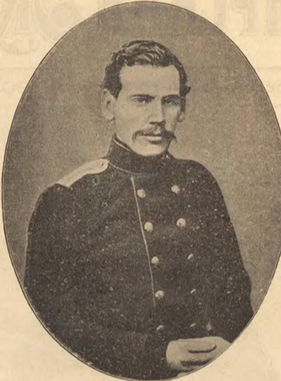
Л. Н. Толстой въ 1857 году.