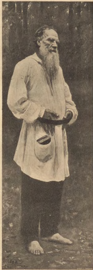
Л. Н. Толстой.