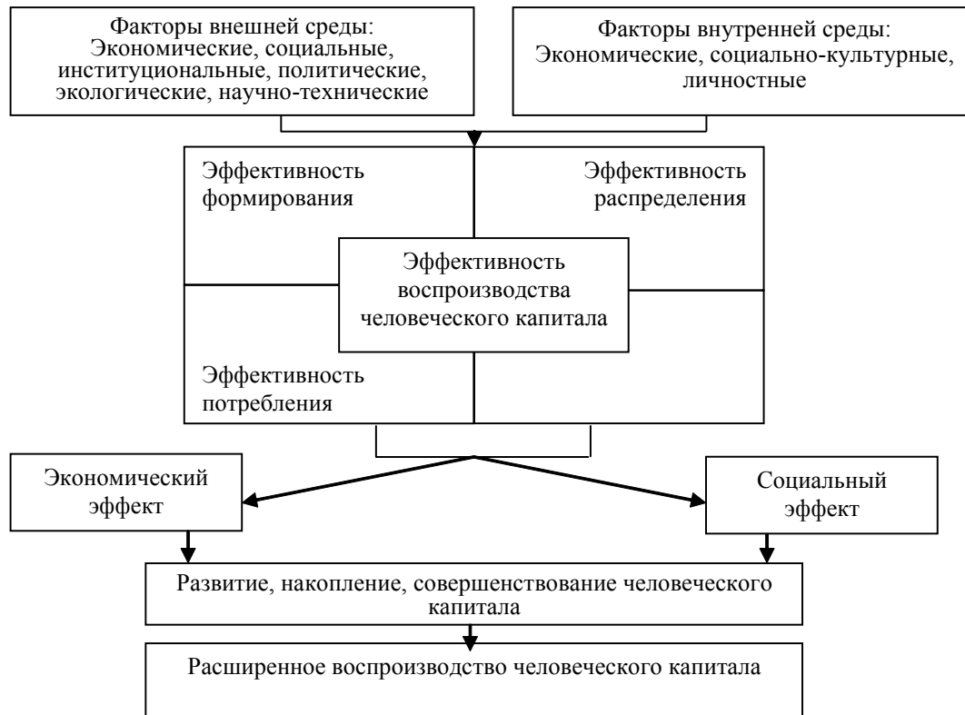
Рис. 3 - Эффективность цикла воспроизводства человеческого капитала [2]

общие для всех знания, умения, навыки, которые позже используются при получении профессии. В этот период домашнее хозяйство должно обеспечивать ребенку доступность образования и сохранение здоровья.