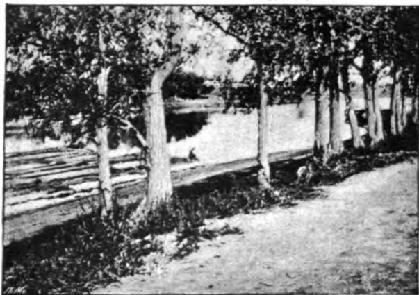
Г. Омскъ. Берегъ р. Оми. (Le bord de la rivière Omi, dans la ville d'Omsk).