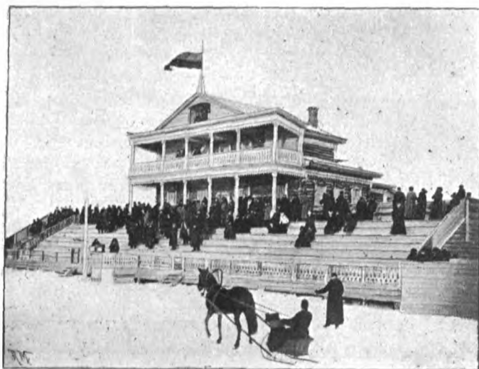
Видъ Томской скаковой сесѣдки. (Vue du pavillon des courses à Tomsk).