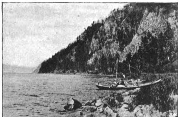
Оз. Байкаль. Мысь Малай Крутая Губа. (Le lac Baïkal. Le cap nommé „Petit golfe“).