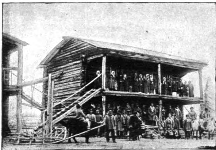
Якуты на праздникъ у своего тайона (головы). (Jakoutes invités à une fête chez leur maire).