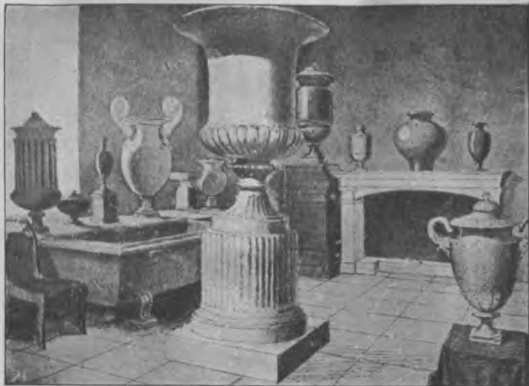
Издѣлія Императорской гранильной фабрики въ селѣ Колыванскомъ, Бійскаго у. (Ouvrages de la fabrique imperiale pour tailler à facettes dans le village Kolivansky).