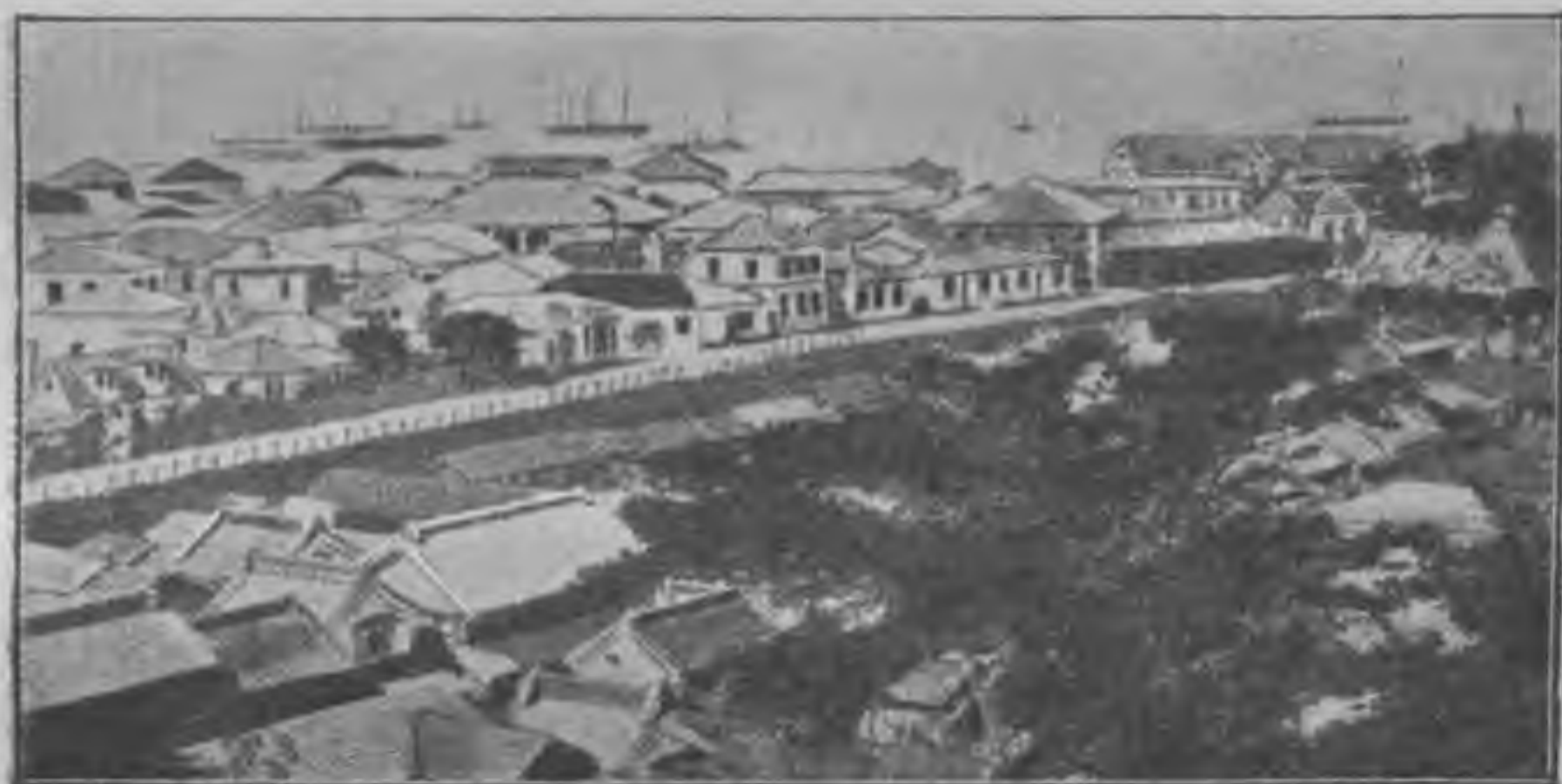
Видъ города Йокагама (въ Японіи). (Vue de la ville Yokohama—dans le Japon).