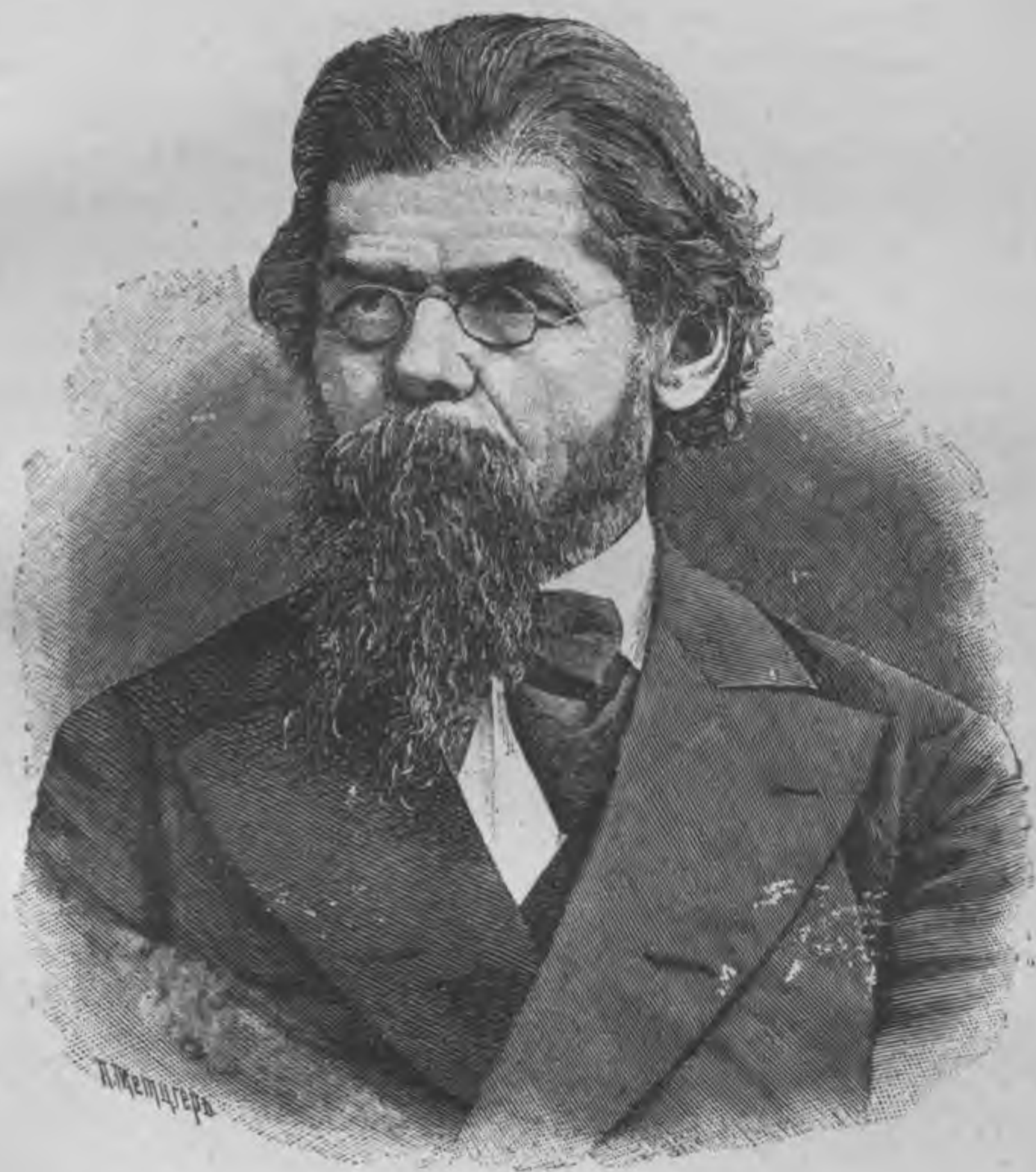
Григорій Николаевичъ Потанинъ. (Gregoire Potanin, célèbre Voyageur russe, originaire de la Sibérie).