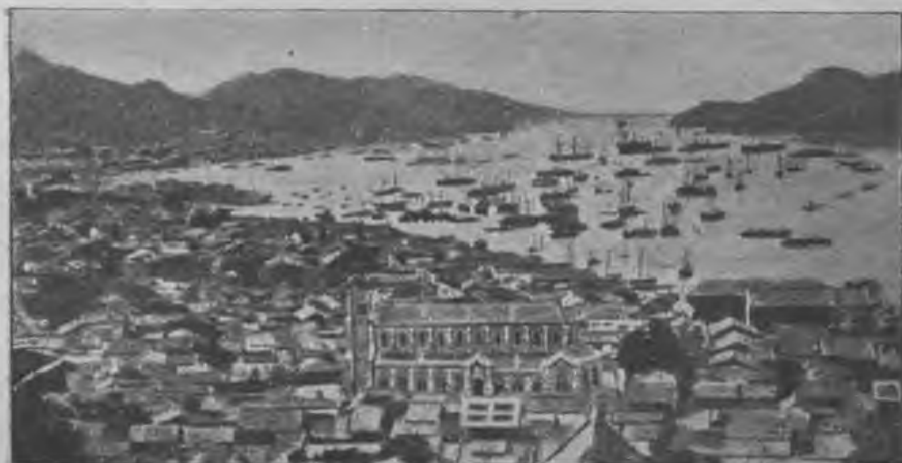
Видъ города Нагасаки (въ Японіи). (Vue de la ville Nagasaki—dans le Japon).