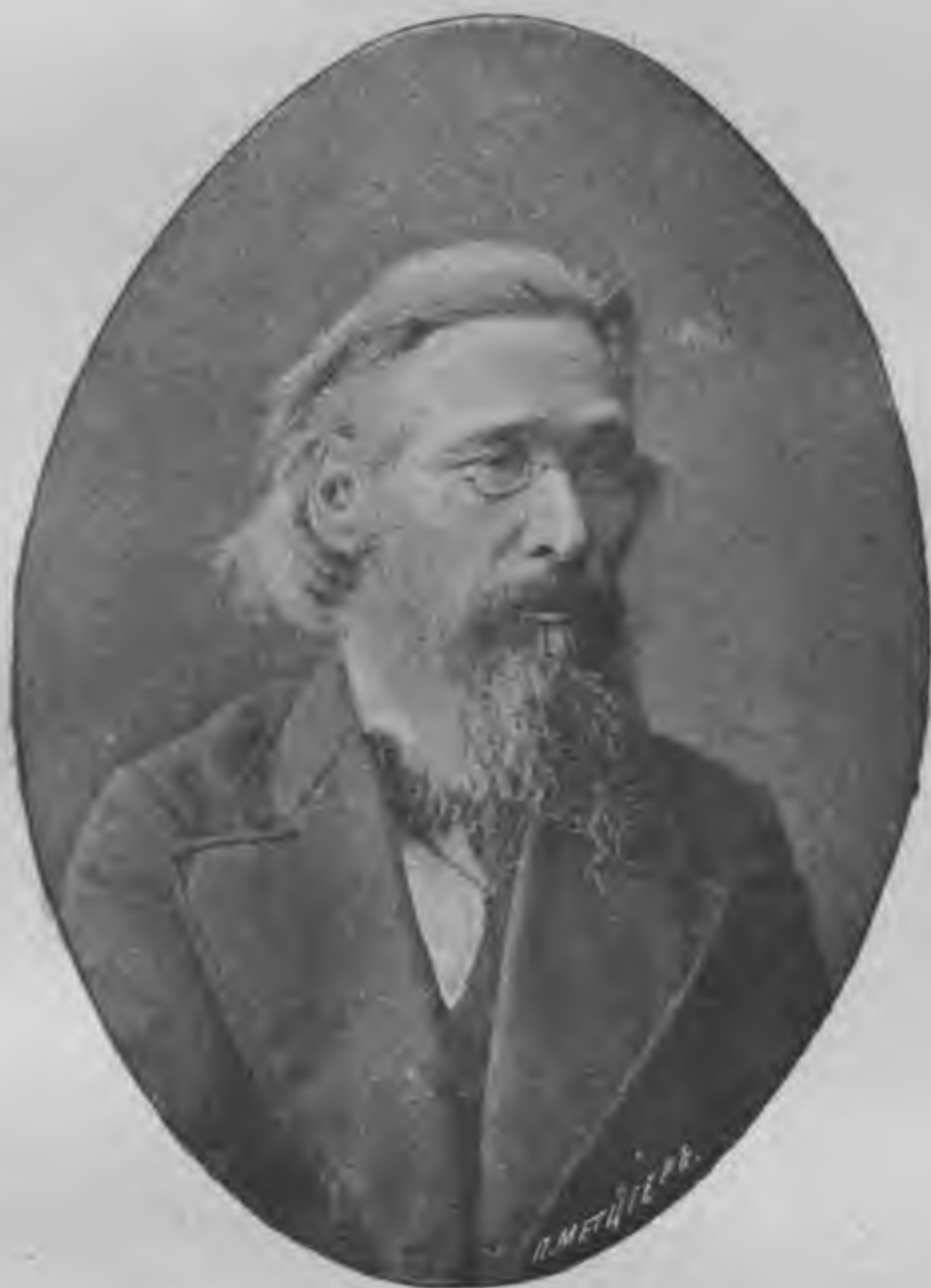
Михаилъ Васильевичъ Загоскинъ, (умеръ 11 сентября 1904 г.). (Michel Zagoskin, très connu dans la littérature Sibérienne). († le 11/24 septembre 1904).