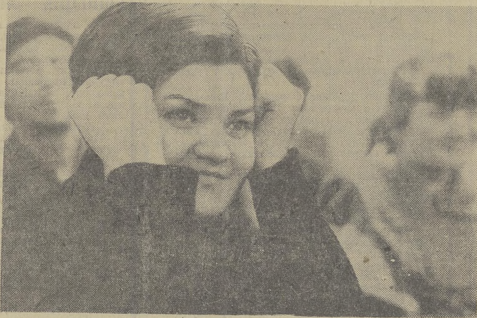
Слова С. ПАСКАРЬ.

Уднюконды что в улыбке? И что у Школьниковой в скрипке? И что в записках у Кюри, И что в полете Терешковой? Что в каждой женщине такого, Чему мы не находим слова, Что скрытым пламенем горит В ее делах, в ее повадках, И делает ее загадкой? Быть может, крайностей сближенье: Взыскательность и снисхожденье Наивность с мудростью самой, С мечтательностью — жажда дела Застенчивость с порывом смелым ...Морозы — летом, — жар зимой.