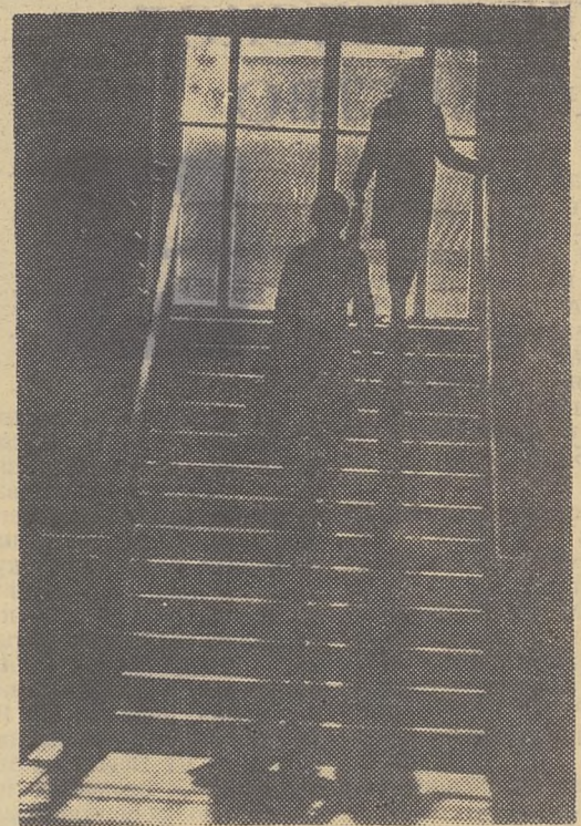
По лестнице к знаниям.