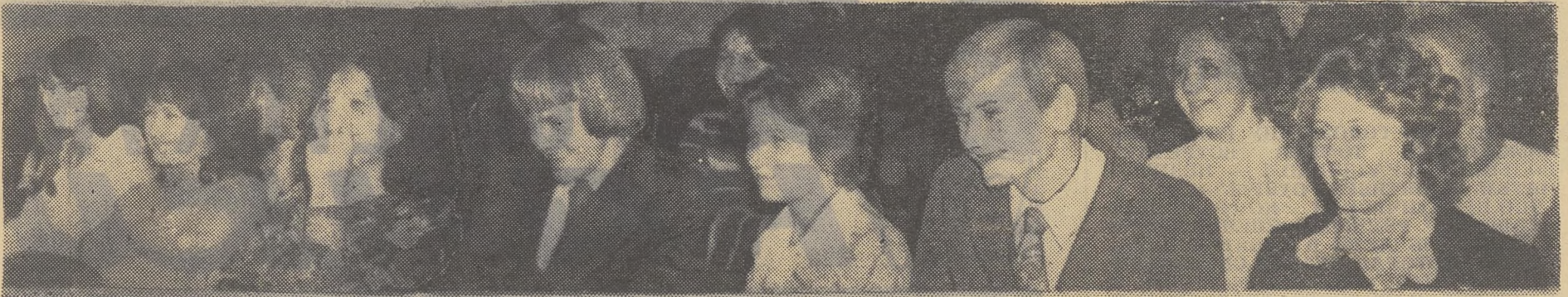
Первокурсники ФФ на факультетском вечере посвящения.