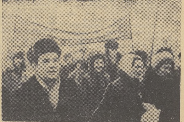
7 ноября 1977 года. Площадь Революции г. Томска.