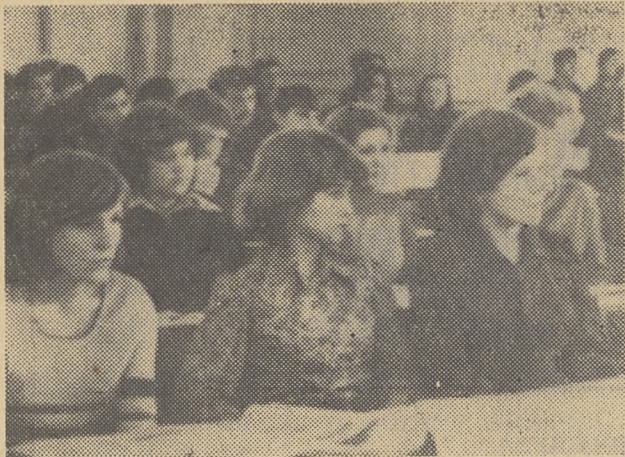
5 января в университете состоялся традиционный «День открытых дверей».

Будущие абитуриенты имели возможность познакомиться со старейшим вузом Сибири. Перед ними выступили ректор университета, проректор по учебной работе, деканы факультетов. Состоялись экскурсии по учебным кабинетам и лабораториям, а также музеям вуза. Посетили гости и ботанический сад.