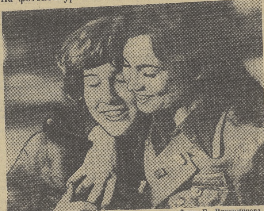
НАМ С ТОБОЙ ПО ПУТИ...