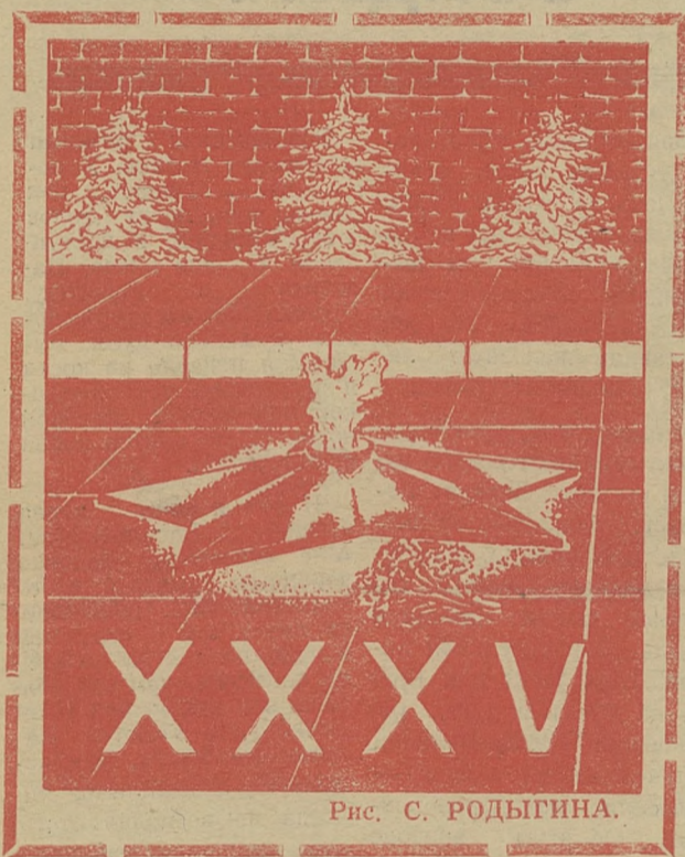
Рис. С. РОДЫГИНА.