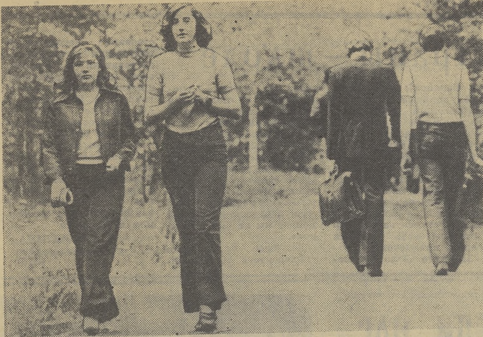
ИЗ ЦИКЛА «СТУДЕНТЫ».