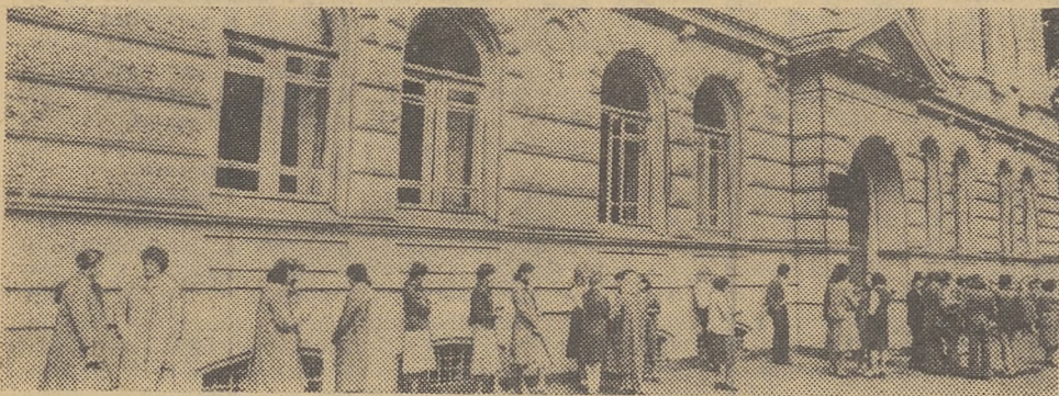
Абитуриентские волнения, кто их не помнит! А теперь многие из этих ребят — студенты.