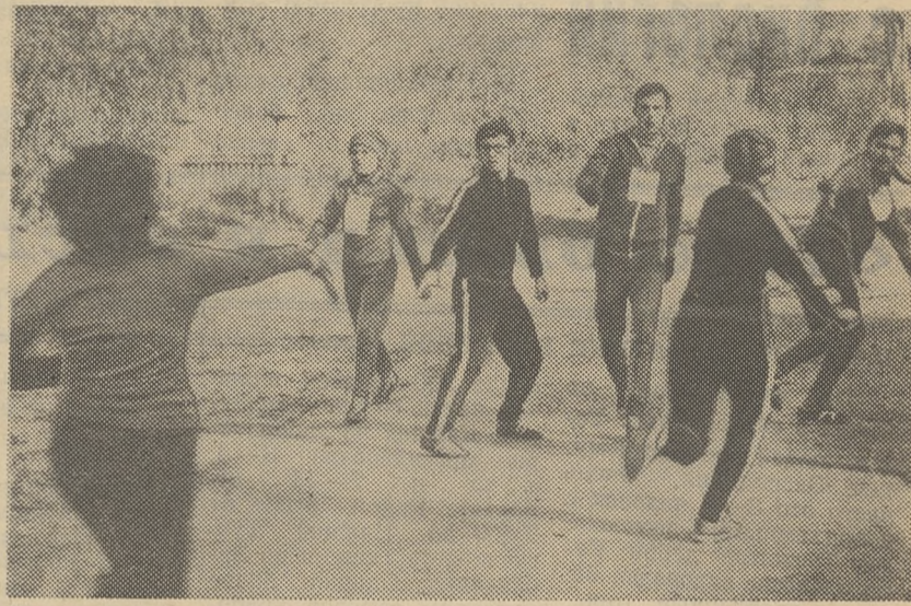
ЛЕГКОАТЛЕТЧЕСКАЯ ЭСТАФЕТА НА ПРИЗ ГАЗЕТЫ «ЗА СОВЕТСКУЮ НАУКУ».