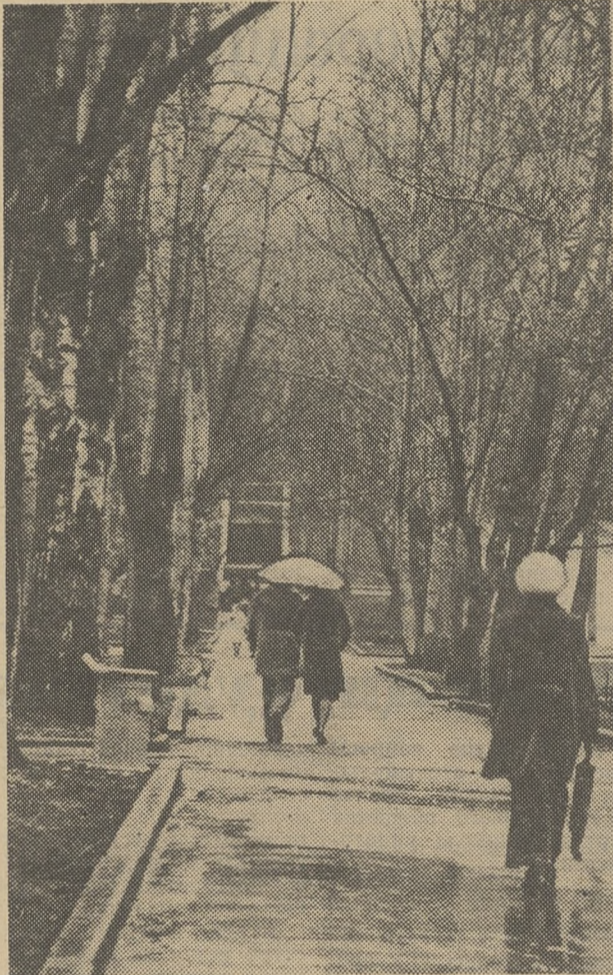
НА ГРАНИЦЕ ОСЕНИ И ЗИМЫ. Фотоэтиюд И. Георгиева.

Снимки принимаются до 11 ноября 1980 года в комитете ВЛКСМ Томского госуниверситета. Наш адрес: пр. Ленина, 36, тел. 3-45-50.