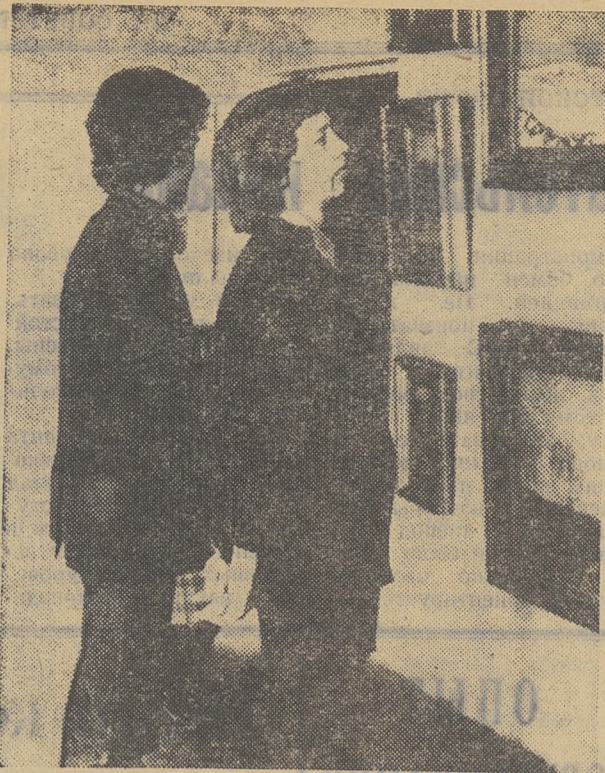
Не пустует конференц-зал Научной библиотеки: здесь просматривают книги, подолгу стоят у картин посетители.