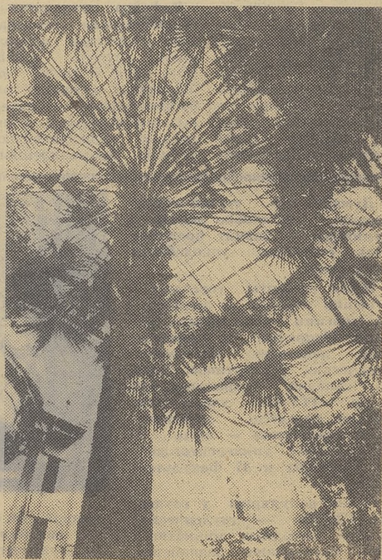
Снимок сделан в Сибирском ботаническом саду.

Работники сада выступают на конференциях и совещаниях с докладами, дают консультации, читают лекции для горожан и на селе. Их трудом создана слава и известность Ботанического сада. А приумножить их — тебе, абитуриент 82!