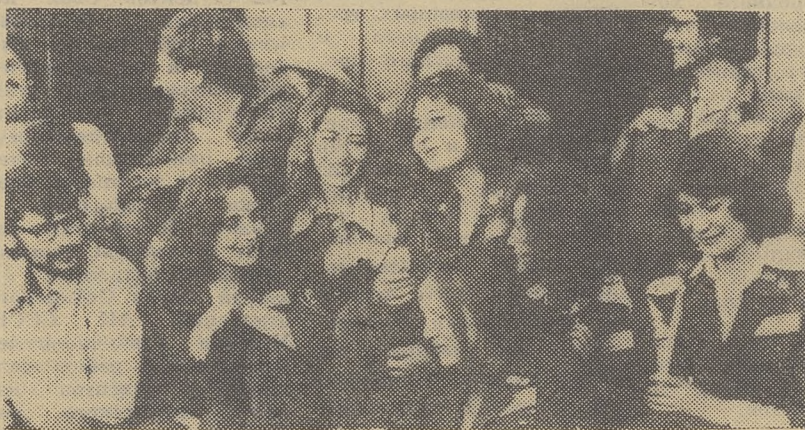
Общественная работа. Что дает она студенту, который завтра молодым специалистом войдет в производственный

коллектив? Очень многое, и первое — учит общению с людьми, учит организовывать малые и большие дела. Чело-