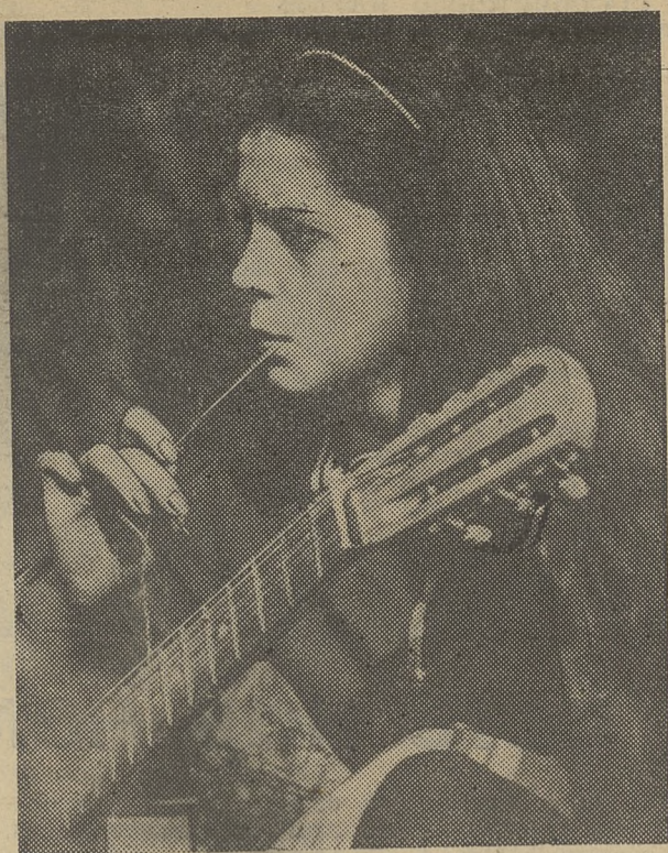
Прощание с летом.

Редакция напоминает директорам НИИ, деканатам БПФ, ММФ, ГГФ, ИФ, ФФ, ФПМК, ФилФ, ХФ, ЭФ, гл. инженеру АХЧ Р. Н. Миньтину, что газете отвечать нужно своевременно и конкретно.