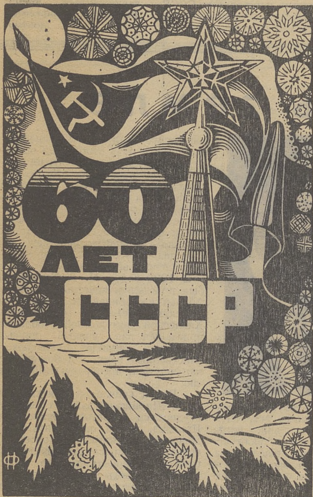
ПЛАКАТ О. НЕДОГОВОРОВА, ФилФ

Сегодня советский многонациональный народ празднует 60-летие Союза ССР, олицетворяющего государственное единство наций и народностей нашей страны. Это живое воплощение идей В. И. Ленина, торжество национальной политики КПСС. 60-летие Союза ССР с большим энтузиазмом отмечает передовая общественность в других странах.