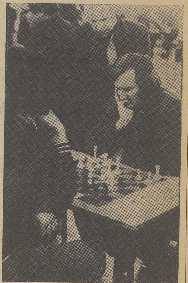
25 декабря состоялся посвященный 60-летию образования СССР шахматный турнир ТГУ — ТПИ на 60 досках. В нем приняла участие 120 шахматистов: ректоры вузов, секретари парткомов, профессора, преподаватели, студенты.