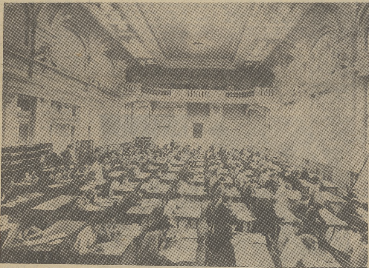
1 августа 1983 года. Сочинение пишут абитуриенты ФилФ.