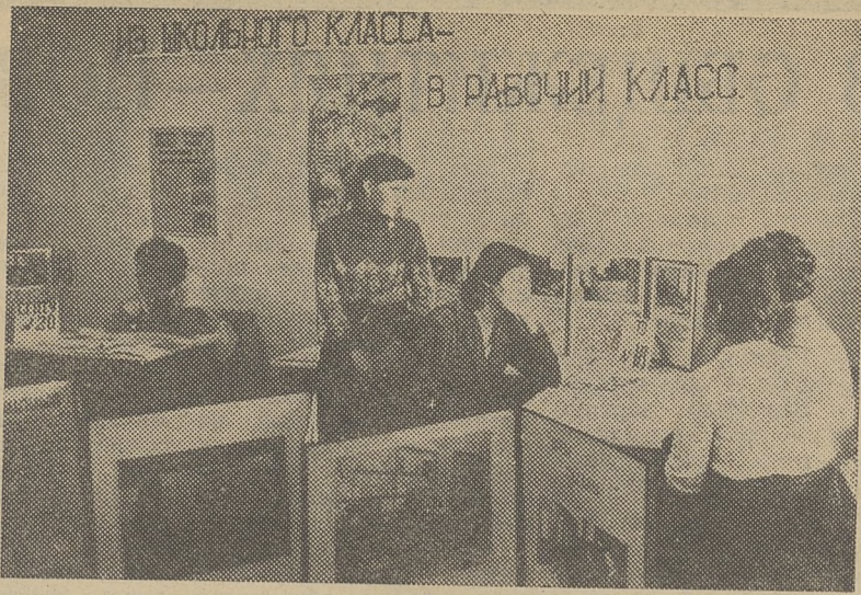
НА СНИМКЕ: в комнате профориентации.

Девять городских профессионально-технических училищ разместили свои стенды в 146-й аудитории главного корпуса. Они предлагают ребятам богатый выбор рабочих профессий. Например, училище № 21 готовит секретарей - машинисток, в него охотно идут девочки, а для парней работа потруднее: бурильщики, работники печати — лито-типисты и т. д. ПТУ № 1 готовит кадры для Томского манометрового завода. Есть тут и кулинарное училище. Готовят в ПТУ токарей, слесарей, фрезеровщиков высоких разрядов.