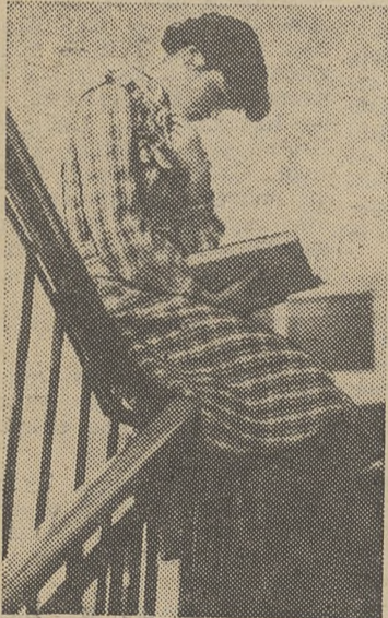
На перилах лучше запоминается...

Разговор наш часто прерывался. Подходили с неотложными делами, требуя внимания, пронзительно звонил телефон.