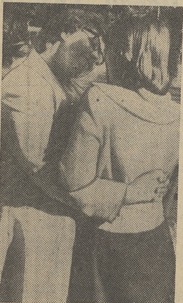
Что мне экзамены, если мама рядом!