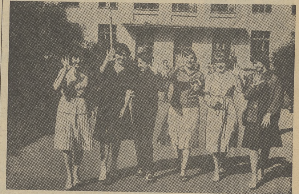
Какое счастье — пятерка по математике! Ведь поступаешь на мехмат. Математика — любимый предмет. А если знаешь его на «отлично», — значит, жизнь прекрасна! НА СНИМКЕ Л. Лейкина: абитуриентки ММФ возвращаются с экзамена.

Л. СУХОТИНА, председатель предметной комиссии по истории, доцент.