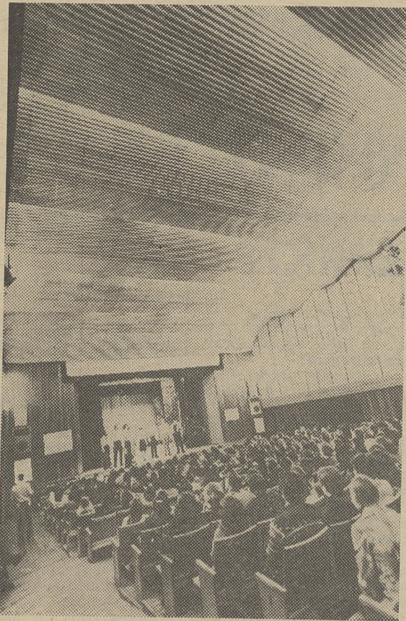
МАТЕРИАЛ ТЕМАТИЧЕСКОГО ВЫПУСКА ПОДГОТОВЛЕН МЕЖВУЗОВОЙ КАФЕДРОЙ ЭТИКИ И ЭСТЕТИКИ ПРИ ТГУ

«ФОРМИРОВАТЬ, ВОЗВЫШАТЬ ДУХОВНЫЕ ПОТРЕБНОСТИ ЧЕЛОВЕКА, АКТИВНО ВЛИЯТЬ НА ИДЕИНО-ПОЛИТИЧЕСКИЙ И НРАВСТВЕННЫЙ ОБЛИК ЛИЧНОСТИ — ВАЖНЕЙШАЯ МИССИЯ СОЦИАЛИСТИЧЕСКОЙ КУЛЬТУРЫ». (Из материалов июньского Пленума ЦК КПСС).