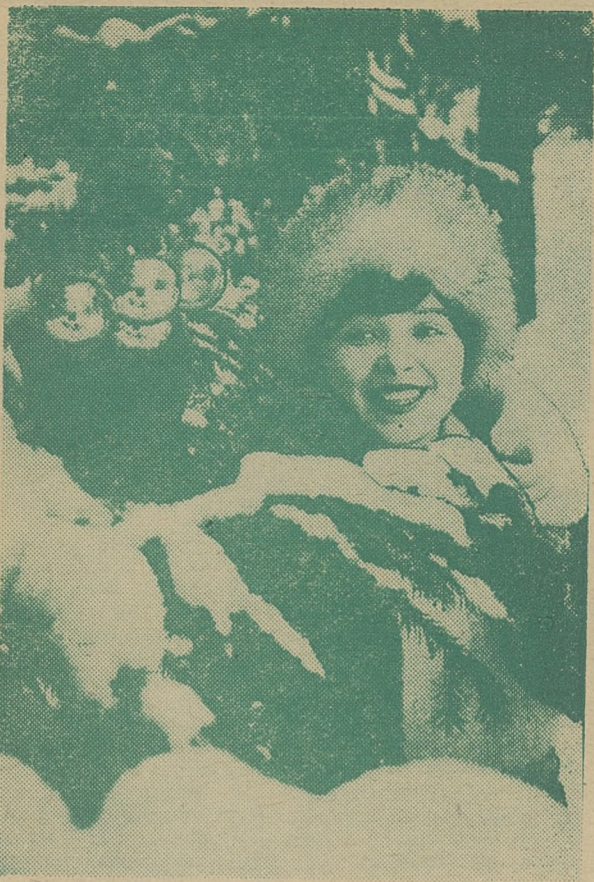
Начнется он без опоздания. В ноль-ноль часов, ноль-ноль минут. Год мира, счастья, созидастья — Таким его все люди ждут.