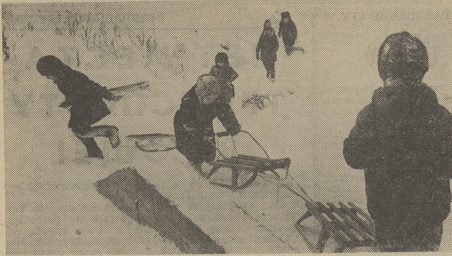
В ПОСЛЕДНИЕ ЗИМНИЕ ДНИ.