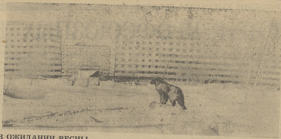
В ОЖИДАНИИ ВЕСНЫ...