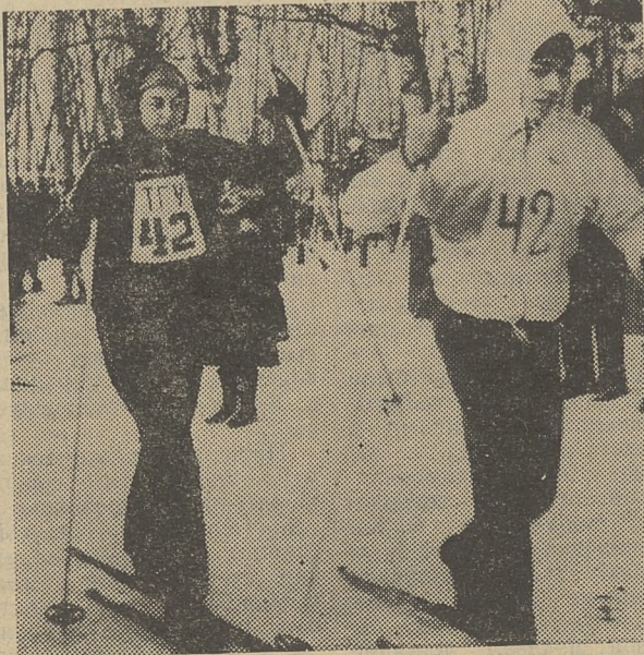
занием. Студенты и сотрудники университета не остались в стороне: они готовы бороться за первые призы первых зимних стартов.