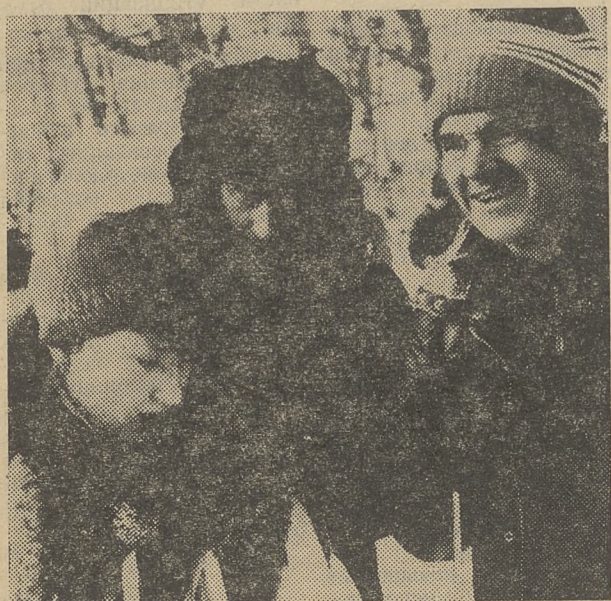
По традиции открытие лыжного сезона томиичи встречают как долгожданный праздник, на котором задорный смех чувствует себя полноправным хо-