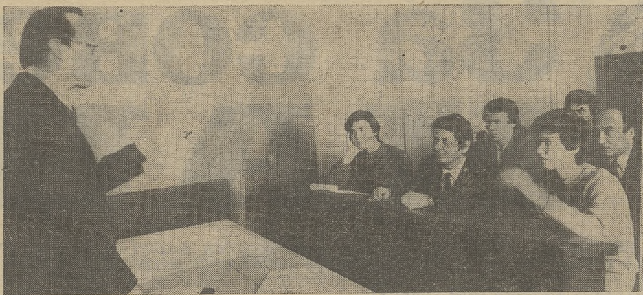
Высокий уровень подготовки специалистов требует большей методической проработки. Этому способствует специальный семинар, одно из заседаний которого снял наш фотокорреспондент. И. ДИК, наш корр

Кафедра ведет активную работу по внедрению целевой интенсивной подготовки специалистов. Основные успехи достигнуты благодаря крепким творческим связям кафедры с НИИ ПММ. Но-