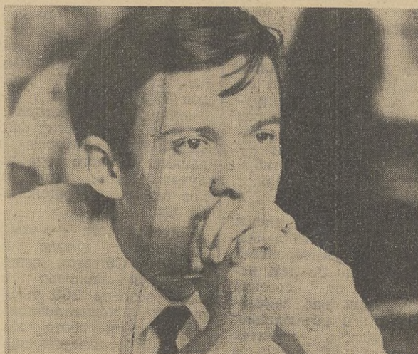
ТРУДНЫЙ ВОПРОС.

Материалы рубрики подготовлены В. НИЛОВЫМ.