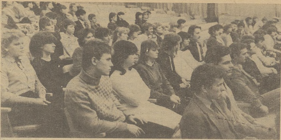
НА СНИМКЕ А. Семенова: участники учебы.