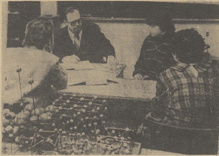
ИНТЕРВЬЮ С ЭКЗАМЕНАТОРОМ

Сессия — это время личного отчета студентов за свой труд. Деканат надеется, что она будет и порой, когда юристы продемонстрируют свою гражданскую зрелость, ответственность в овладении профессией, которую они выбрали на всю жизнь.