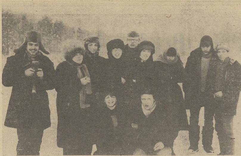
14—16 февраля коллектив литературно-художественного театра ФилФ побывал в Стрежевом и вахтовом поселке Вах.

Отрывки из спектаклей «Маяковский — сам» и «Канте-хондо» по стихам Г. Лорки были тепло встречены нефтяниками Севера.