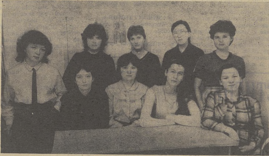
1351-я. Но даже в выходной день у девушек так много дел, что собрать всю группу не удалось.

Группе 1351 ФилФ всего полгода. Но уже сейчас с уверенностью можно сказать, что здесь сложился крепкий, дружный коллектив. Это показала первая сессия, по итогам которой группа 1351 стала лучшей на своем курсе (абсолютная успеваемость 100 процентов, качественная 36 процентов). Интересно живут девушки в неурочное время, вместе бывают в театре, филармонии... Педотряд, лекторская группа, народный театр, спорт, капелла — вот еще не весь круг деятельности студентов группы. В ходе общественно-политической аттестации активность большинства оценена на «хорошо» и «отлично».