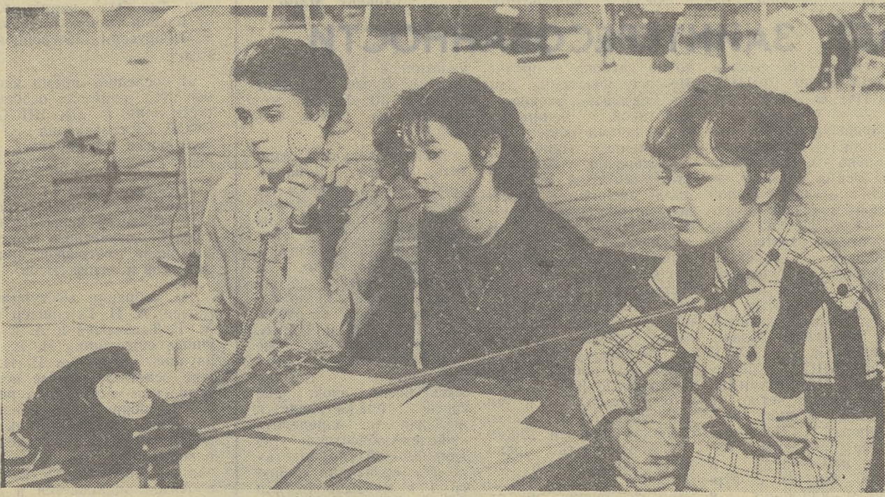
НАВСТРЕЧУ XX СЪЕЗДУ ВЛКСМ

О продолжении разговора вы узнаете в следующем номере.