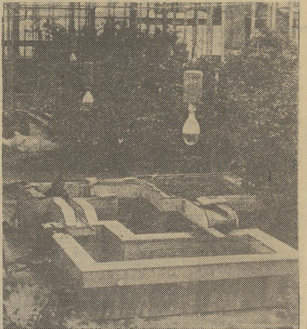
В оранжерее Сибирского ботанического сада закончен монтаж электрооборудования, строители приступили к внутренней отделке помещения.