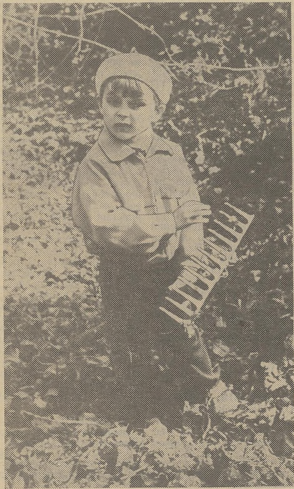
5 июня — день окружающей среды. Всем, кого интересуют проблемы экологии, в следующем номере мы предложим подборку материалов на эту тему.