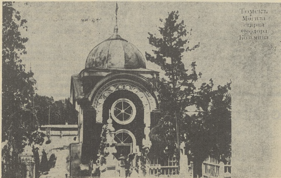
Могилы старца Федора Кузмича

Так или иначе феномен Федора Кузмича интересен в наибольшей степени как раз отношением к нему в обществе. Вполне очевидно, что интерес к тайне старца повышался, как правило, в те периоды, когда историческое время как бы замедляло свой бег. И напротив, когда время обретало упругость серьезных целей и свершений, интерес этот падал, а сама тайна воспринималась как исторический курьез, как странный и диковинный случай. Так, видимо, и нужно относиться к ней.