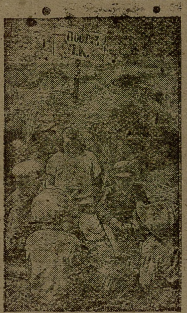
На охране хлебов.

За день 11 сентября в колхозе сжато серпами 4,5 га, выкошено машинами 43,4 га, поднято развалившиеся суслоны на 42 га, вспахано зяби 16 га. На работе было занято 254 колхозника и 122 лошади. Все 4 бригады 11 сентября работали хорошо.