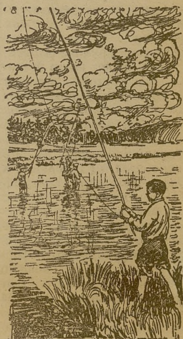
Летние каникулы школьников Зенковской средней школы, Прокопьевского района, Новосибирской области, заполнены всевозможными развлечениями.

Комсомол здесь в стороне от воспитания ребят. Можно ведь организовать пионеротряд, проводить с детьми игры, беседы. М.