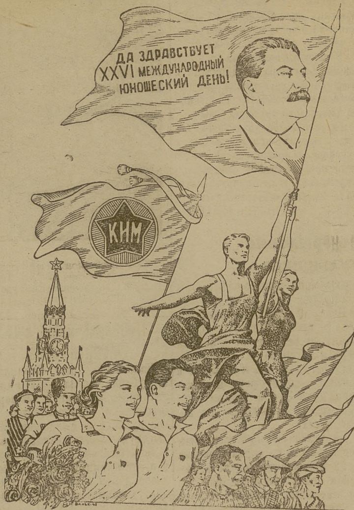
Рисунок Г. Вальк.

излишний жилой фонд и всех нуждающихся в жилой площади. В первую очередь новую жилую площадь получают многосемейные рабочие и служащие. Квартирная комиссия предоставляет в их распоряжение свои грузовики.