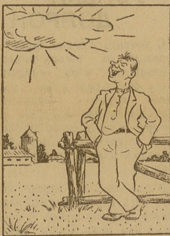
Настроение есть, солнышка нет...