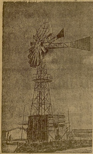
В колхозе имени Карла Маркса (Азовский район, Омская обл.) установлен ветродвигатель, подающий воду на фермы колхоза.