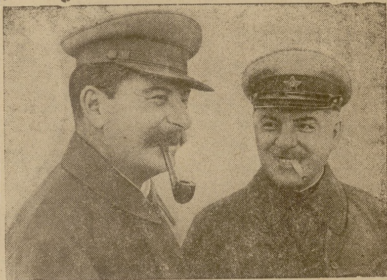
Н. В. Сталин и К. Е. Ворошилов (1935 г.)

4 февраля исполняется 60 лет со дня рождения КЛИМЕНТА ЕФРЕМОВИЧА ВОРОШИЛОВА—первого Маршала Советского Союза, заместителя председателя Совнаркома СССР и члена Политбюро ЦК ВКП(б).