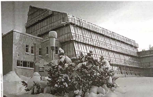
Та самая оранжерея высотой в 31 метр. Ничего подобного нет нигде в мире.

Сегодня в Томске на термометрах минус 10, а согласно метеорологу на следующее недели города ожидают 40-градусные морозы. Таким образом, сейчас это единственное место в мире, где в такую стужу цветут тропические сады.